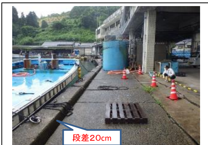
大浦第1岸壁 老朽化状況