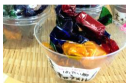
はったい粉キャラメル