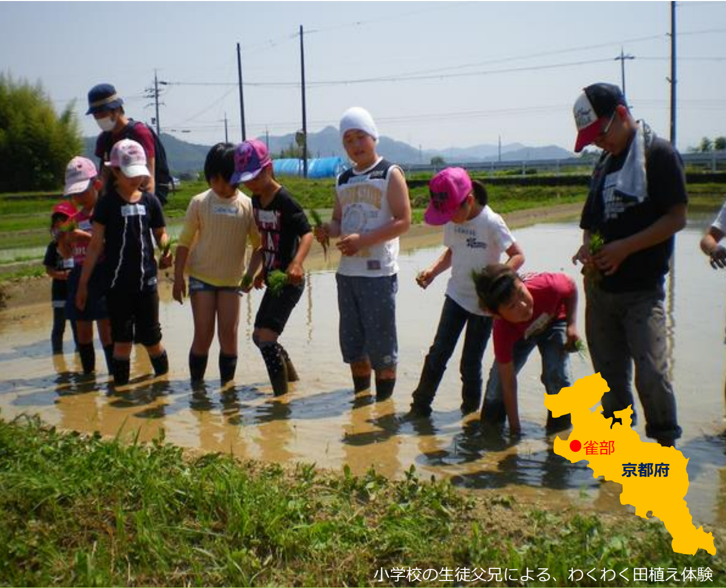
小学校の生徒父兄による、わくわく田植え体験

水路の生き物棲息調査 自然保護の啓発や環境保全に関する意識向上に努め、地元への愛着をもつ活動へ