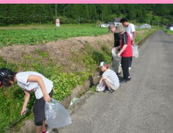
子ども会の環境美化

地域の農業・農地を次世代に引き継ぐため魅力ある農業の展開を！ ～「京力農場プラン」との連携～