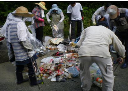
農地水路等のゴミ集めと選別