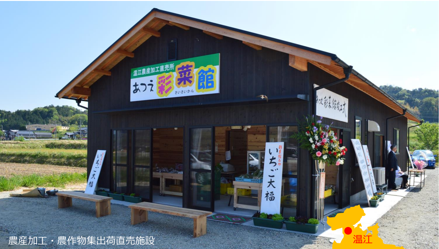
農産加工・農作物集出荷直売施設