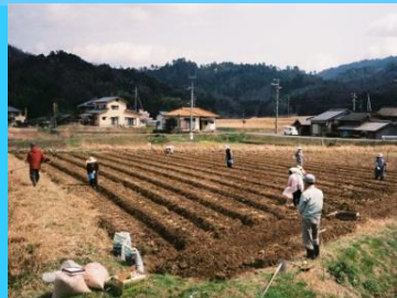
加工品用農産物の生産