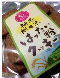
はったい粉クッキー