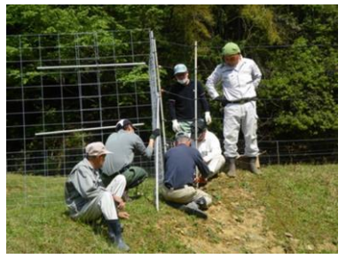
獣害防止柵の設置