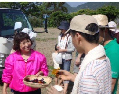
加工所メンバーによる試作品提供