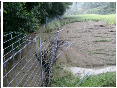
土砂災害の水田被害調査