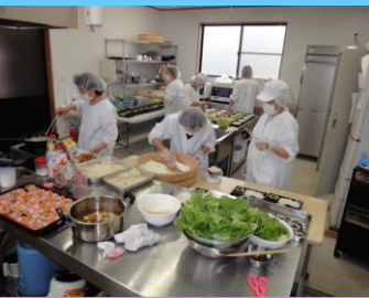
女性による加工部

温江で生産された野菜やその野菜を使ったお惣菜、お弁当などを販売 農業者だけでなく地域が一体となり関わることができている