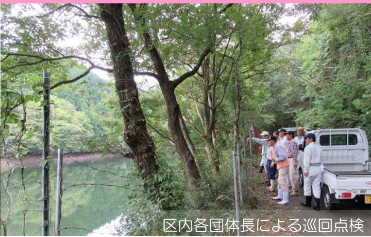
区内各団体長による巡回点検