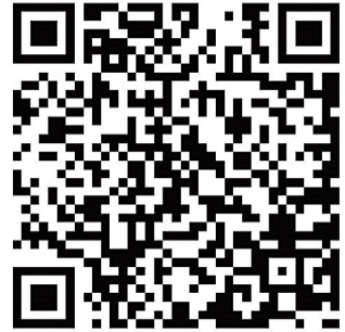
「アクセス・スクールバスダイヤ」