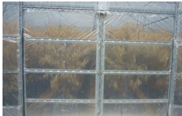
密閉高温蒸し込み