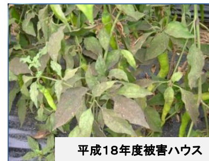
平成18年度被害ハウス