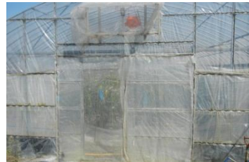
開口部への防虫ネット被覆