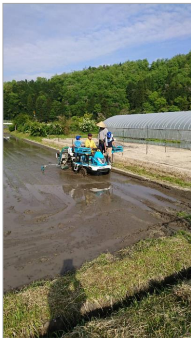
子ども達と田植え