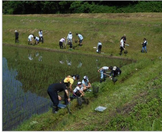
地元住民や学生と共に生き物調査