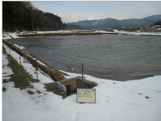
生物多様性のために冬期湛水