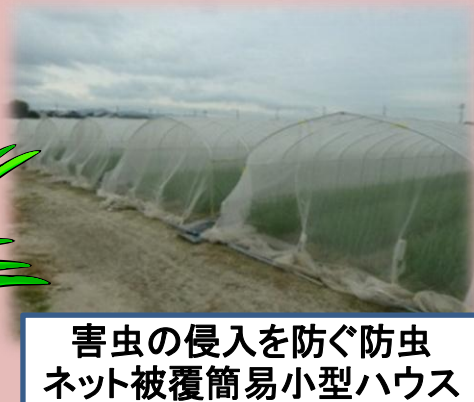
害虫の侵入を防ぐ防虫ネット被覆簡易小型ハウス