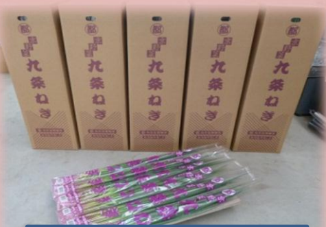
九条ねぎ生産が拡大