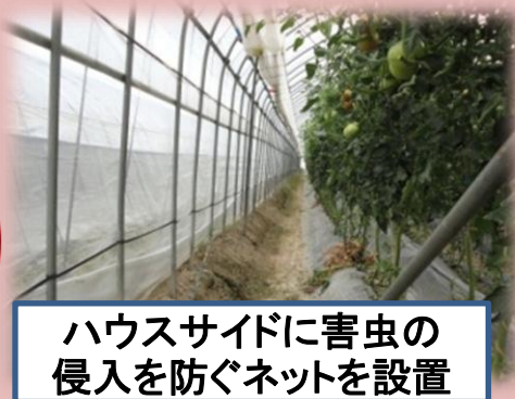
ハウスサイドに害虫の侵入を防ぐネットを設置