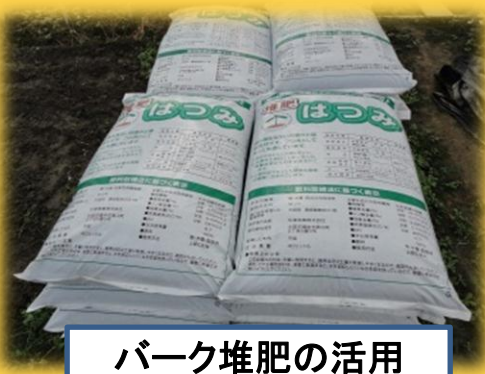
パーク堆肥の活用