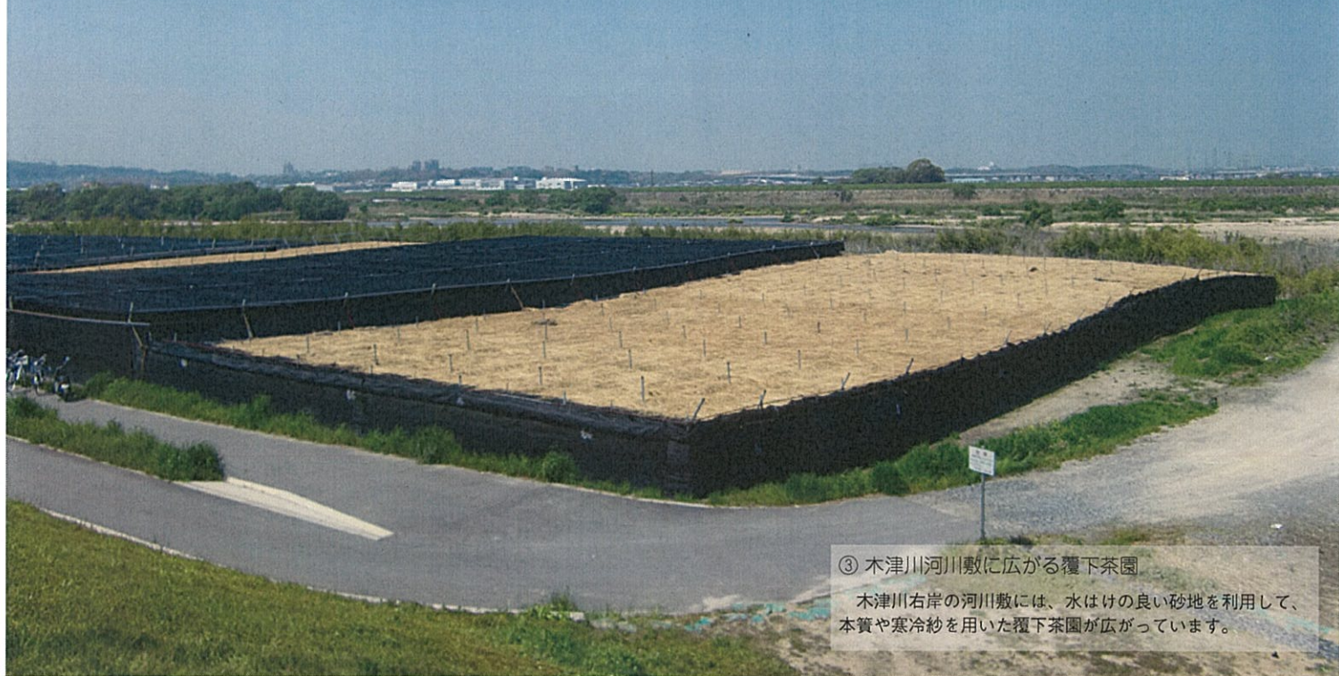
③ 木津川河川敷に広がる覆下茶園

木津川右岸の河川敷には、水はけの良い砂地を利用して、本質や寒冷紗を用いた覆下茶園が広がっています。