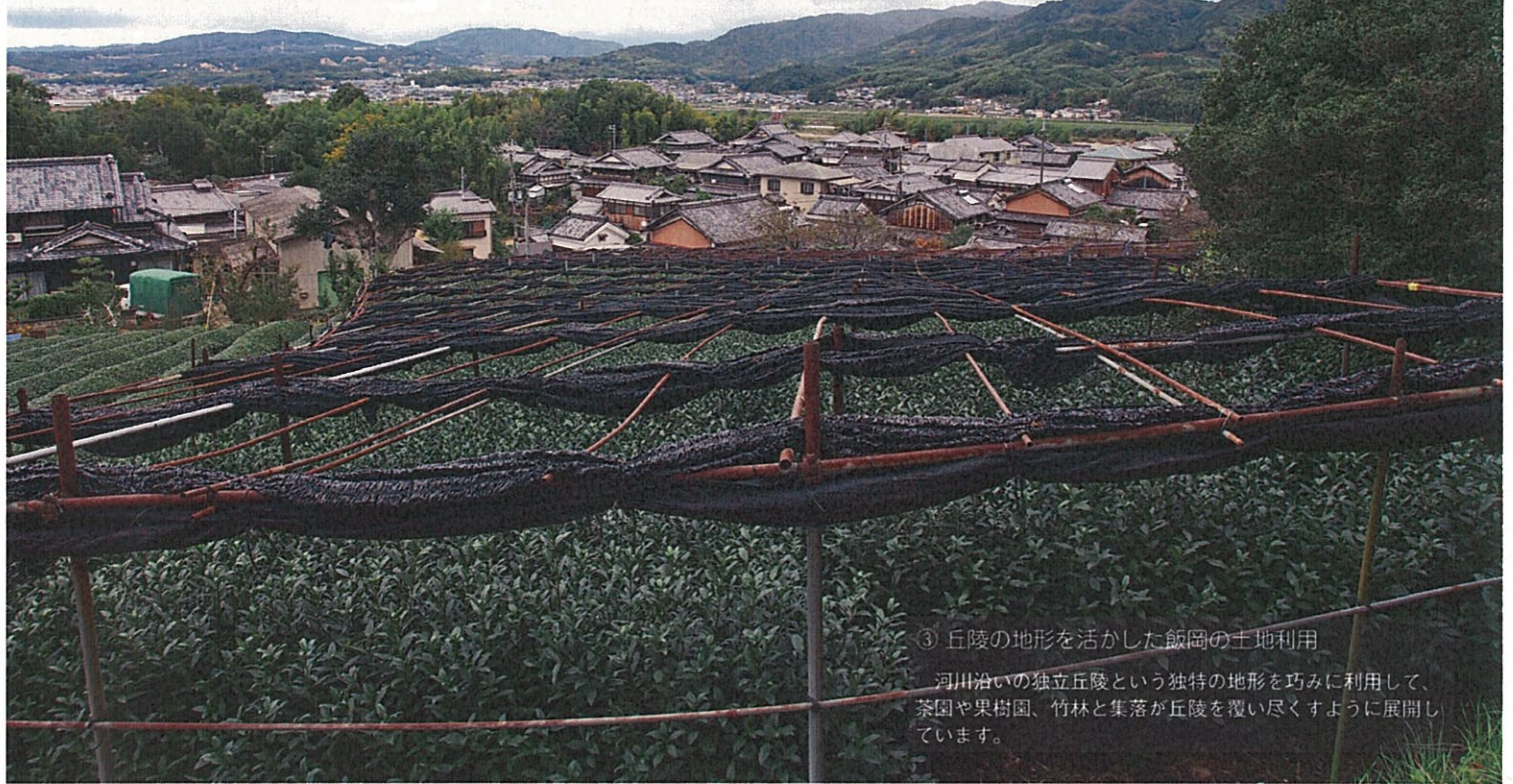
③ 丘陵の地形を活かした飯岡の土地利用

河川沿いの独立丘陵という独特の地形を巧みに利用して、茶園や果樹園、竹林と集落が丘陵を覆い尽くすように展開しています。