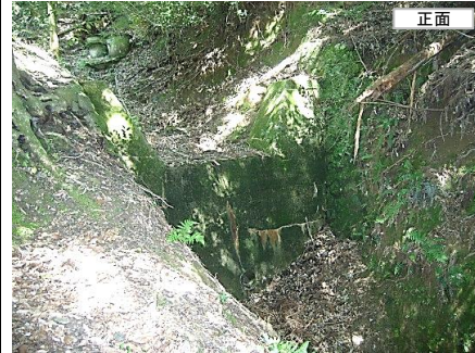
① 既設治山ダム(昭和50年度施工)の正面及び堆砂状況