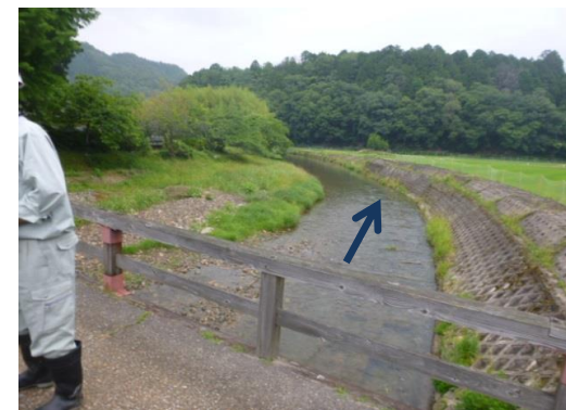
摩気橋下流の状況