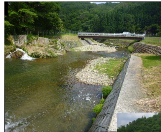
提案箇所を望む。 下流護岸、対岸護岸と比べても階段工部分は高い 大篠橋前後で土砂堆積