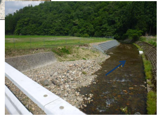
提案箇所を望む。 下流護岸、対岸護岸と比べても階段工部分は高い 大篠橋前後で土砂堆積