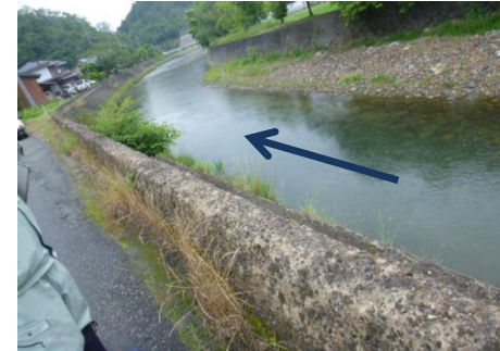
根詰めブロックが流亡