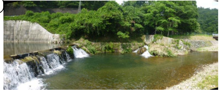
取水口付近は階段工が設置済