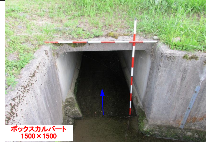
ボックスカルバート 1500×1500