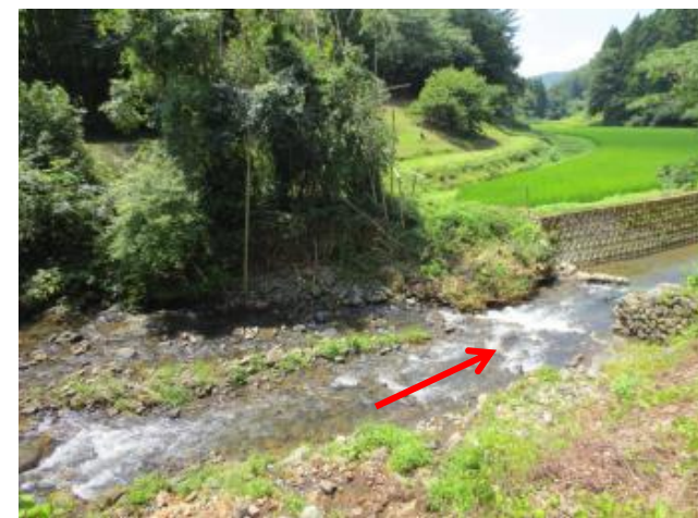
下流から1 全壊箇所