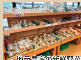
地元農家の新鮮野菜