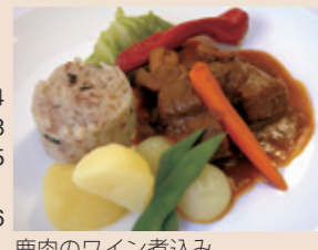
鹿肉のワイン煮込み