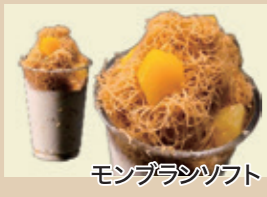
モンブランソフト

野山の景色を眺めながら、のんびりと地域の食材を生かした食事やスイーツを楽しんでいただけます。春は山菜、夏は鮎、秋は黒大豆、栗、冬はジビエと季節時々のお味が楽しめる道の駅です。