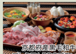
京都府産黒毛和牛プレミアムBBQプラン