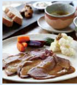
ジビエ料理（鹿肉、猪肉）