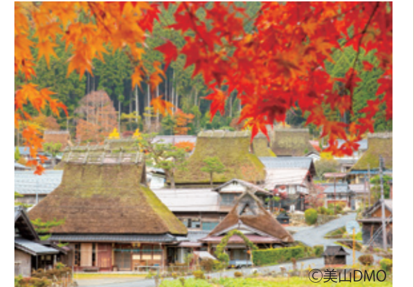
美山かやぶきの里

主屋、納屋、倉の3棟で構成されており、地域の方から昔の暮らしを聞くことができるほか、縁側でゆっくりとかやぶきの景色を眺められる場所もあります。