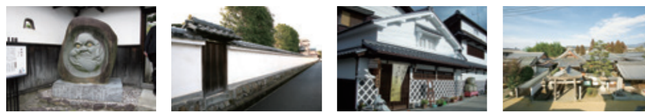
聖隣寺 境内には信長の供養塔が ●JR亀岡駅観光案内所 TEL 0771-22-0691