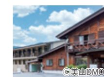
河鹿荘(かじかそう)とジビエ料理

刻一刻、美しく移りかわる山々の景色と、懐かしい日本の原風景・かやぶき民家に出会える美山町。集落内約40棟のかやぶき民家は、今も人々が住まうききたる伝統建造物。民俗資料館やちいさな藍美術館もおすすめです。