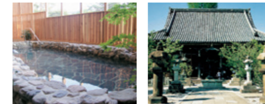
京都・烟河 六太寺