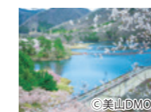
日本風景街道「美山かやぶき由良里(ゆらり)街道」

かやぶきの里近くの「美山町自然文化村」では、日帰り入浴、キャンプ、レンタサイクルが楽しめます。地元でとれた鹿・猪肉を使ったジビエ料理もどうぞ。