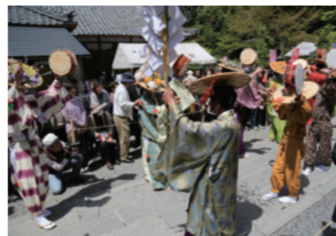
〔お問合せ先〕 出雲大神宮 鎮花祭(毎年4月18日) がんこ楽々荘 TEL 0771-56-8880 丹山酒造 TEL 0771-22-0066 亀岡市ふるさとバスのダイヤ案内… TEL 0771-23-8000 (京阪京都交通亀岡営業所)