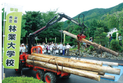
林業大学校(京丹波町)のオープンキャンパス

加えて、地域が一体となって支える森林の保全や筏流し等、伝統的な京都丹波ならではの歴史・文化を次代に継承・発展させていくことがもう一つの課題となっています。