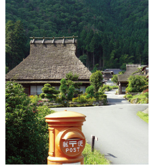
美山かやぶきの里

懐かしい日本の原風景として知られる「美山かやぶきの里」は、地域が一体となって魅力を磨き、長年にわたる情報発信を通じて全国的知名度を得た「京都丹波」を代表するスポットの一つであり、京都市域との間を結ぶ嵯峨野トロッコ列車や保津川下りは、「京都丹波」を訪れる観光客にとって欠かすことのできない魅力的な観光資源です。また、湯の花温泉は歴史の深さを感じさせる質の高い温泉・宿泊機能を提供し、他の温泉施設も多様なリラクゼーション・いやしの場を提供しています。このほか、各地の社寺や地域住民が守り伝えてきた伝統芸能、さらに道の駅や自然を満喫できるアウトドアスポーツ等随所に新しい集客施設等が備わり、地域の魅力を高めています。