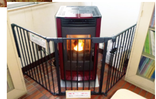
ペレットストーブ (ペレットに製材端材等を使用)