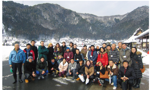
美山かやぶきの里を訪れる海外からの観光客

このため、首都圏を中心とした観光プロモーションの取組等を展開していますが、京都丹波のイメージを確立するには至っていません。小規模な観光資源・施設が各地に点在していることから、広域観光の推進を通じて、京阪神地域近郊のリラクゼーションの場として認知度を高め、国内をはじめ海外からの誘客促進等により、地域経済への波及効果を高めるさらなる事業展開が課題となります。