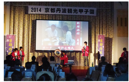
京都丹波観光甲子園