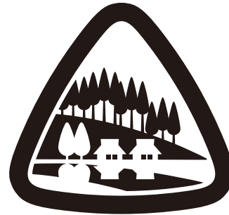
「森の京都」ロゴマーク

京都の歴史や文化・豊かな暮らしを支えてきた森の景観を抽象的造形で表象化。樹木や水源をたたえ多様な動植物を育む豊かな森と、四季の移ろいと共に暮らしを営む里に流れる凜とした空気感を、山を象った図形の中に印象的なシルエットで表現したもの。