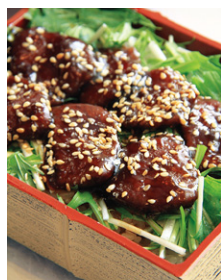
こだわり! 京都丹波のごちそう 「美山鹿あまから飯」

◇管内に立地する企業や大学食堂と連携し、京都丹波の地場野菜を活用した昼食の提供や適切な量と質の食事を選択して摂取できる食環境の体制整備と健康づくりを推進します。