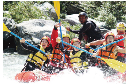
保津川ラフティング