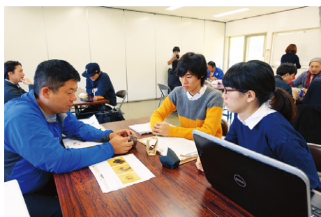
京都精華大学と連携し 「七彩スイーツ」のデザインを検討

さらには新たな新規国定公園指定等の強みをいかし、食による里山のおもてなしや健康づくり等を展開する「養生の里プロジェクト」を推進し、教育体験旅行をはじめとする新顧客の開拓に努め、内外からの交流促進と賑わいづくりを進めます。