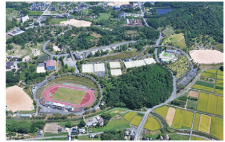
丹波自然運動公園

◇京都スタジアム(仮称)や丹波自然運動公園の京都トレーニングセンター(仮称)の整備、新規国定公園の指定、「STIHLの森京都」(府民の森ひよし)のリニューアル等、地域資源をいかしたスポーツ観光による交流・賑わいづくりに取り組みます。