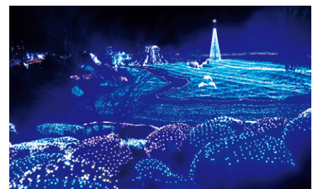
るり溪の新たなイルミネーション 「京都イルミエール」