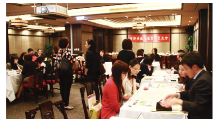
台湾での観光プロモーション