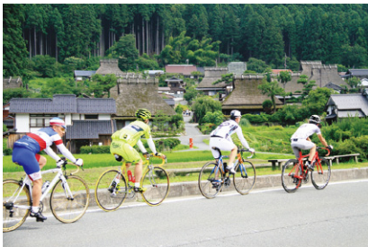
美山でのサイクリング