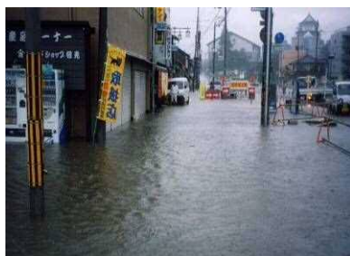
平成15年8月（園部町市街）