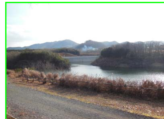
(右岸林道より遮水擁壁工を見る。)