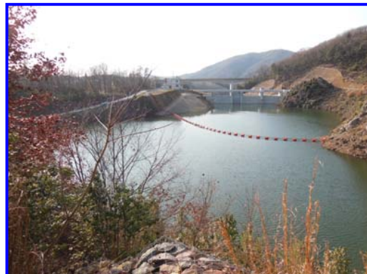
(右岸林道よりダム上流を見る。)