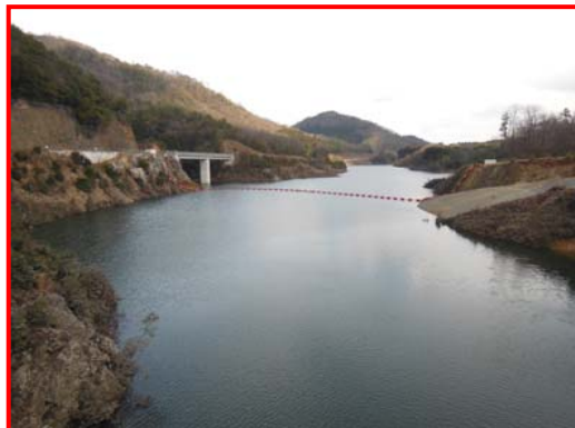
(ダム天端より上流を見る。)