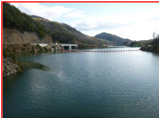
(ダム天端より上流を見る。)