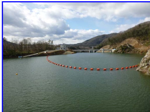
(右岸林道よりダム上流を見る。)