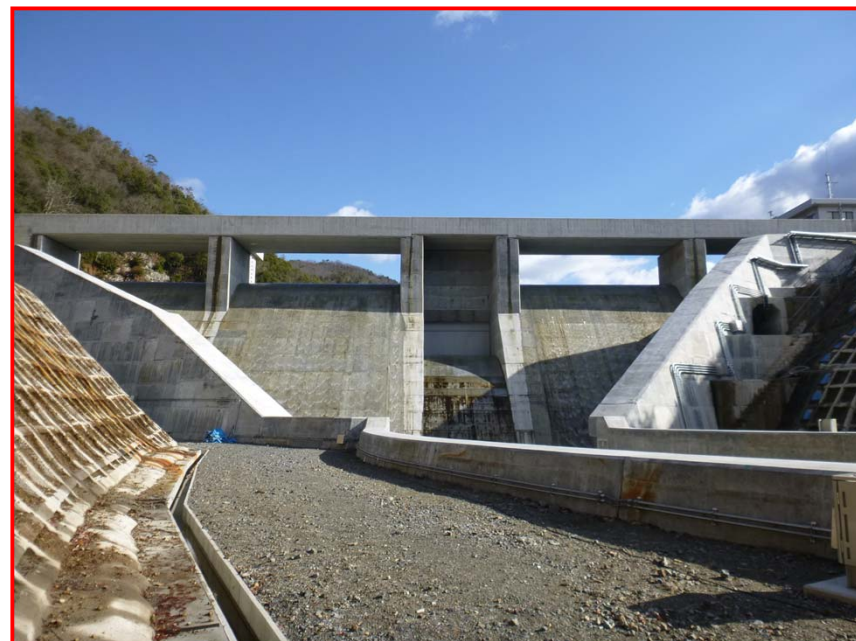
（下流からダムを見る。）