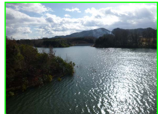
(右岸林道より遮水擁壁工を見る。)