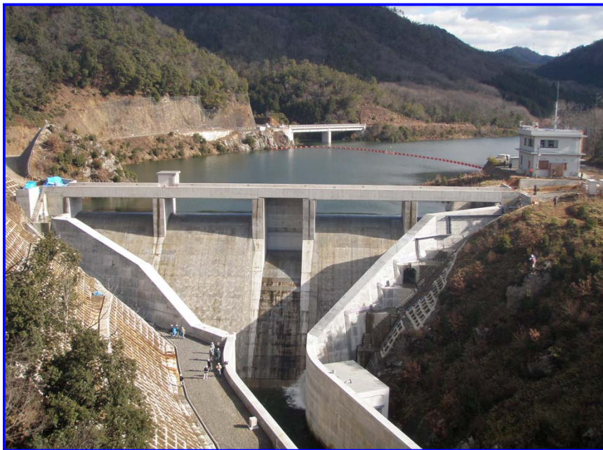
（国道27号からダムを見る。）