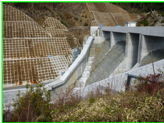
（左岸下流からダムを見る。）