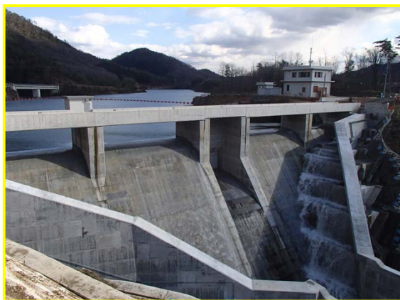
（右岸下流からダムを見る。）