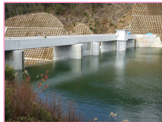
（左岸上流からダムを見る。）