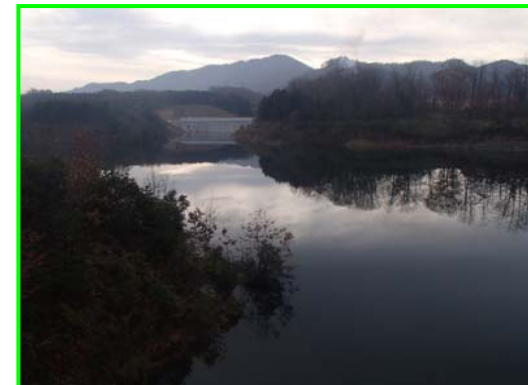
(右岸林道より遮水擁壁工を見る。)