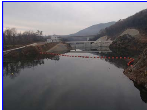
(右岸林道よりダム上流を見る。)