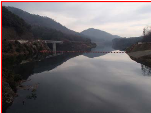
(ダム天端より上流を見る。)