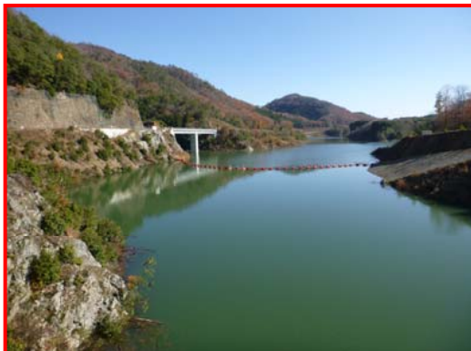
(ダム天端より上流を見る。)