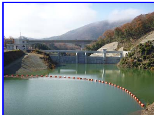
(右岸林道よりダム上流を見る。)