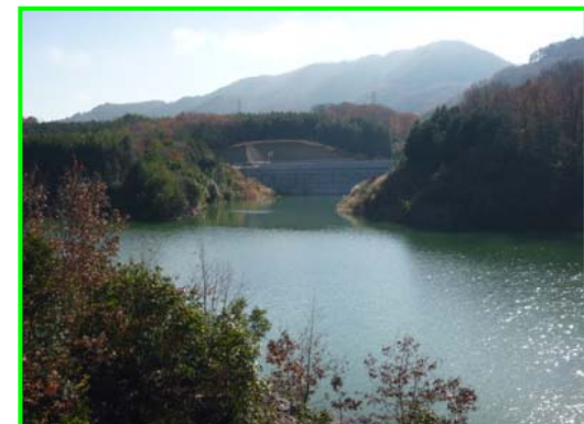
(右岸林道より遮水擁壁工を見る。)