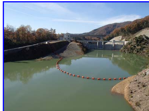
(右岸林道よりダム上流を見る。)