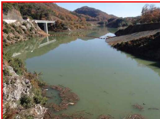
(ダム天端より上流を見る。)