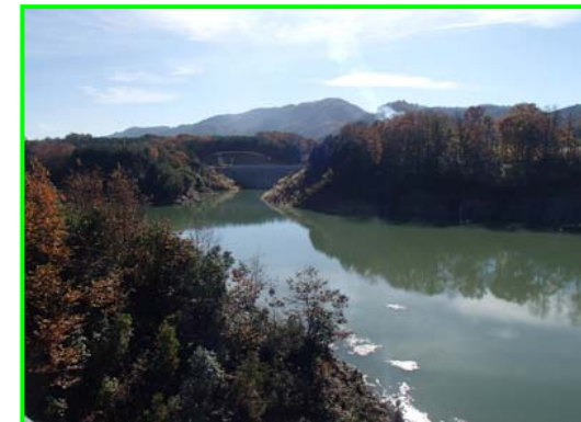
(右岸林道より遮水擁壁工を見る。)