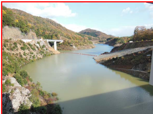
(ダム天端より上流を見る。)