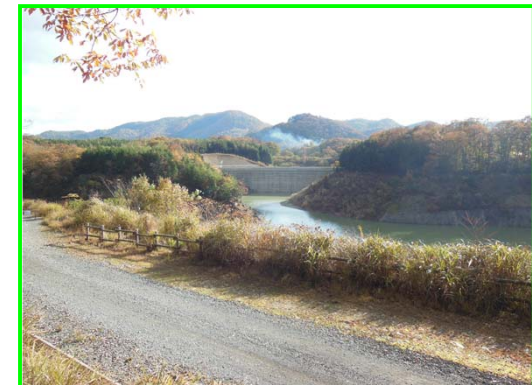
(右岸林道より遮水擁壁工を見る。)