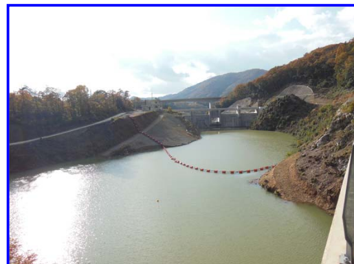
(右岸林道よりダム上流を見る。)