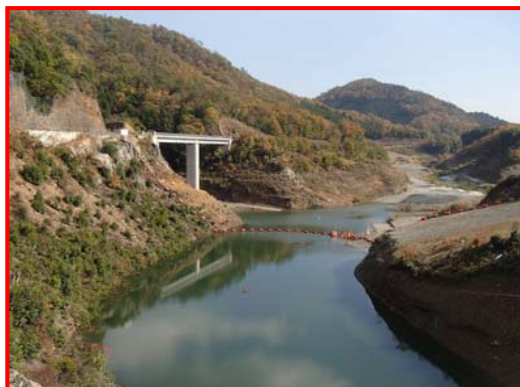
(ダム天端より上流を見る。)