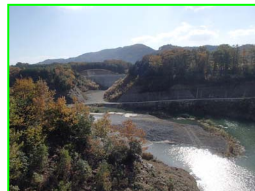
(右岸林道より遮水擁壁工を見る。)