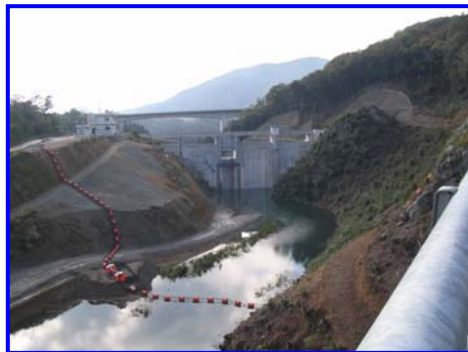
(右岸林道よりダム上流を見る。)