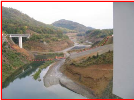
(ダム天端より上流を見る。)