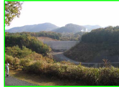
(右岸林道より遮水擁壁工を見る。)