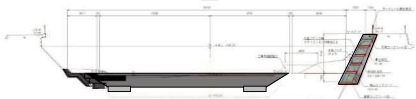
（園部大橋上流は R5 設計）