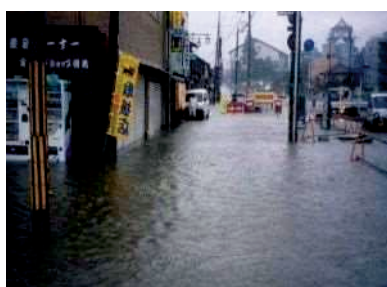
平成15年8月（園部町市街）