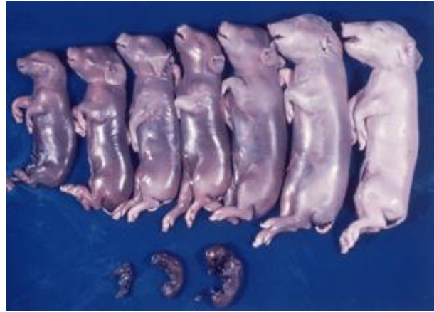
(日本脳炎による死産例: 農研機構HP)

感染豚との接触や汚染器具を介して感染が広がる為、年間を通じて発生します。感染すると日本脳炎同様異常産を引き起こします。