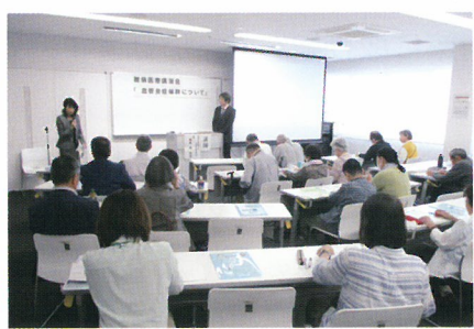
北部会場：ふくちやま市民交流プラザ

各疾患について最新の治療から日常生活上の工夫まで大変丁寧に御講義いただき、アンケートでも「病気とのつきあい方がわかった」「周りにこれだけの人が同じ病気で闘っており、ひとりじゃないんだと思えた」など前向きな感想が多く寄せられました。北部・南部会場あわせて145名もの方に御参加いただきました。当日の資料等は当センターHPにも掲載しておりますので是非そちらも御覧ください。