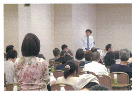
南部会場：京都平安ホテル