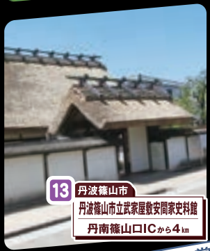
13 丹波篠山市 丹波篠山市立武家屋敷安岡家史料館 丹南篠山口ICから4km