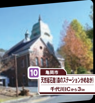
10 亀岡市 天然礫石館(緑のステーションかめおか) 千代川ICから3km