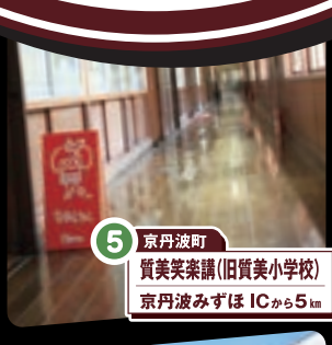
5 京丹波町 質美笑楽講(旧質美小学校) 京丹波みずほICから5km