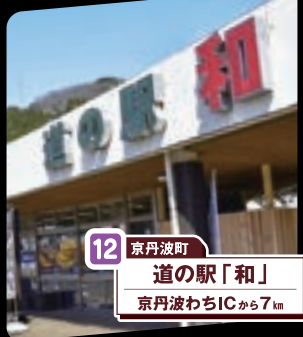
12 京丹波町 道の駅「和」 京丹波わちICから7km