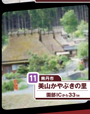
11 南丹市 美山かやぶきの里 園部ICから33km