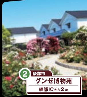
2 綾部市 ガンゼ博物苑 綾部ICから2km