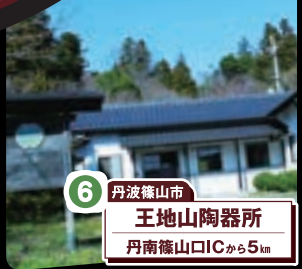
6 丹波篠山市 王地山陶器所 丹南篠山口ICから5km