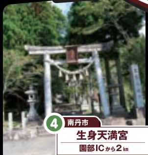
4 南丹市 生身天満宮 園部ICから2km