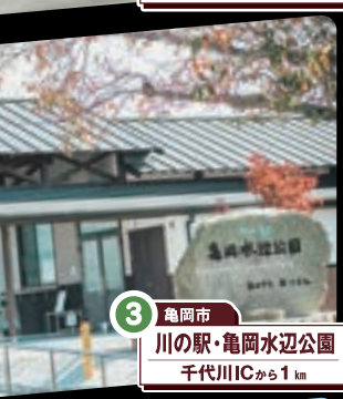
3 亀岡市 川の駅・亀岡水辺公園 千代川ICから1km