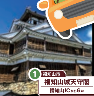
1 福知山市 福知山城天守閣 福知山ICから6km

2024年 9.1(日)~11.30(土) DAITAMBA DRIVE STAMP RALLY