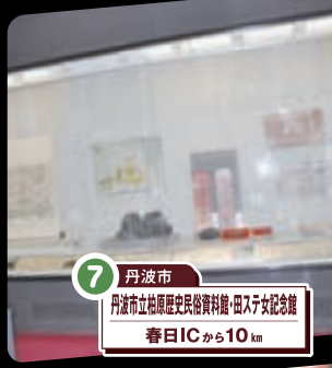
7 丹波市 丹波市立松原歴史民俗資料館・四ッ子女記念館 春日ICから10km