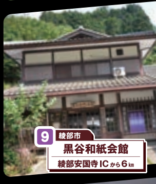
9 綾部市 黒谷和紙会館 綾部安国寺ICから6km