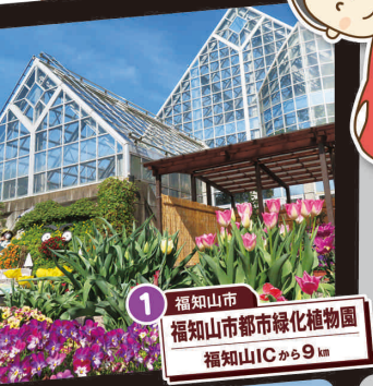
1 福知山市 福知山市都市緑化植物園 福知山ICから9km