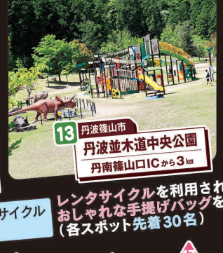
13 丹波篠山市 丹波並木道中央公園 丹南篠山ICから3km