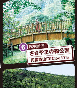
6 丹波篠山市 ささやまの森公園 丹南篠山ICから17km