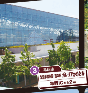
3 亀岡市 生涯学習施設「道の駅 ガレリアかめおか」 亀岡ICから2km