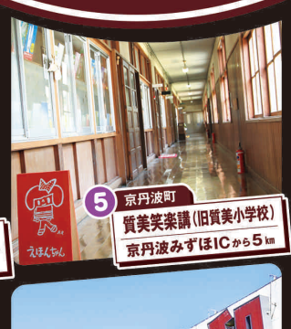
5 京丹波町 質美笑楽講(旧質美小学校) 京丹波みずほICから5km