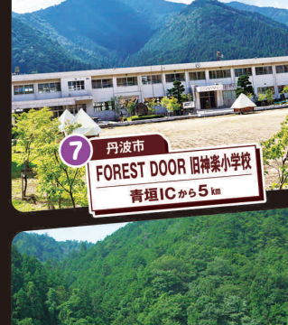
7 丹波市 FOREST DOOR 旧神楽小学校 青垣ICから5km