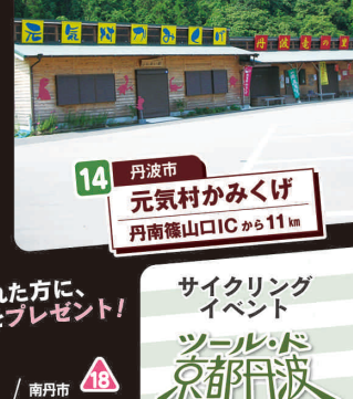
14 丹波市 元気村かみくげ 丹南篠山ICから11km