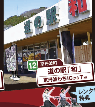
12 京丹波町 道の駅「和」 京丹波わちICから7km