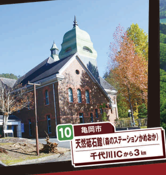
10 亀岡市 天然庵石庵(道の駅かめおか) 千代川ICから3km