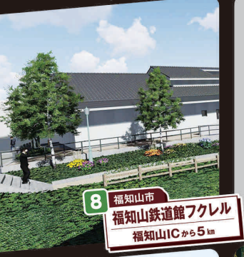
8 福知山市 福知山鉄道館フレール 福知山ICから5km