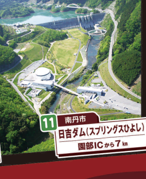
11 南丹市 日吉ダム(スプリングスひよし) 園部ICから7km