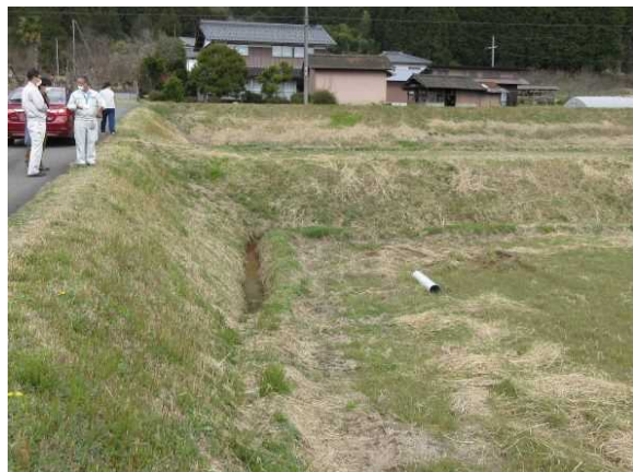
農家毎の管理提案書を手渡しして現地指導