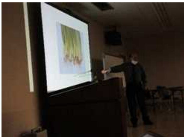
淡路農事研究会講師の講義