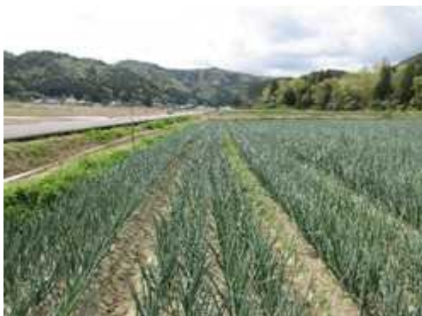
4月中旬のタマネギほ場