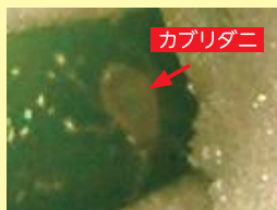
アザミウマを花の中で待ち伏せるカブリダニ