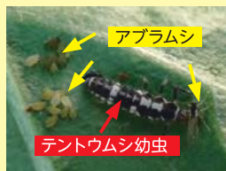
アブラムシを食べるテントウムシの幼虫