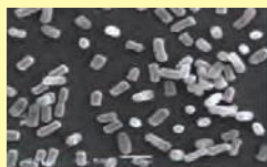
選択した乳酸菌株