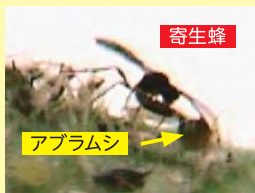
アブラムシの体内に産卵する寄生蜂