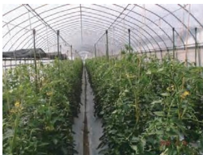
H27 トマト栽培(2本仕立て)