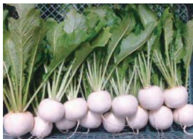
生産している野菜(かぶら)