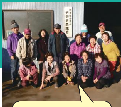
ホテルとびかう水明の郷