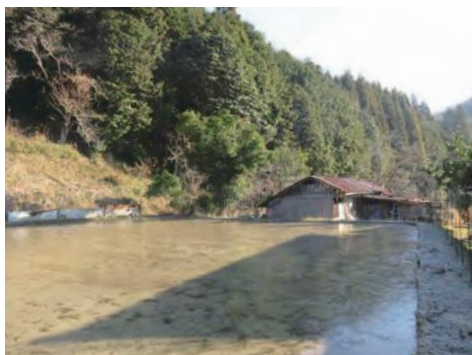
冬季湛水中のほ場