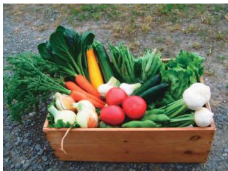
生産している野菜（トマト、ニンジンなど）