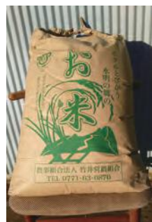
丹波の黒豆(2L サイズ手選別品) コシヒカリ 特別栽培米