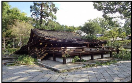
平成 30 年 台風第 21 号 平成 30 年 9 月 4 日 (平野神社拝殿倒壊 (京都市北区、府指定建造物))