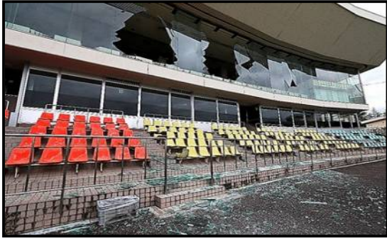
平成 30 年 大阪北部地震 平成 30 年 6 月 18 日 (窓ガラスが破損した京都向日町競輪場 (向日市))