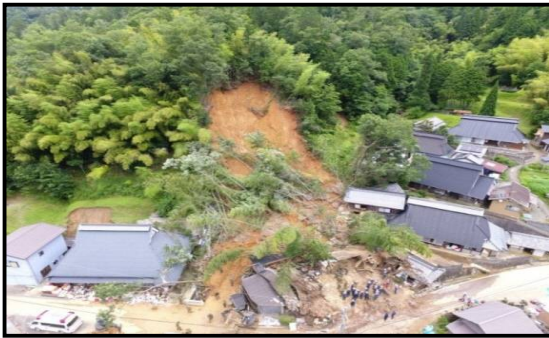
平成 30 年 7 月豪雨 平成 30 年 7 月 6 日～7 月 8 日 (綾部市上杉町の土砂崩れ現場)