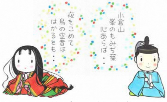
(清小糸内言)小倉百人一首歌碑 (貞信公)