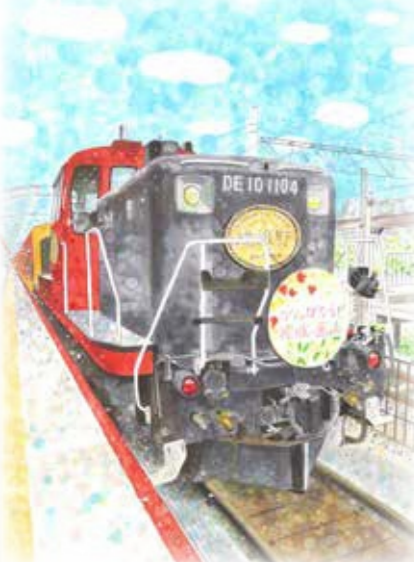
山嵯山我野トロッコ列車