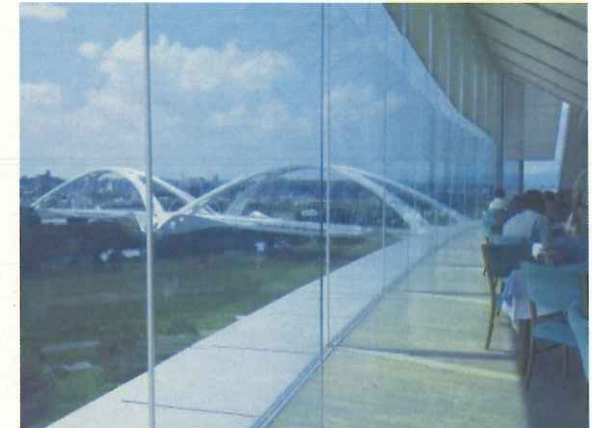
展望レストラン（豊田スタジアム）