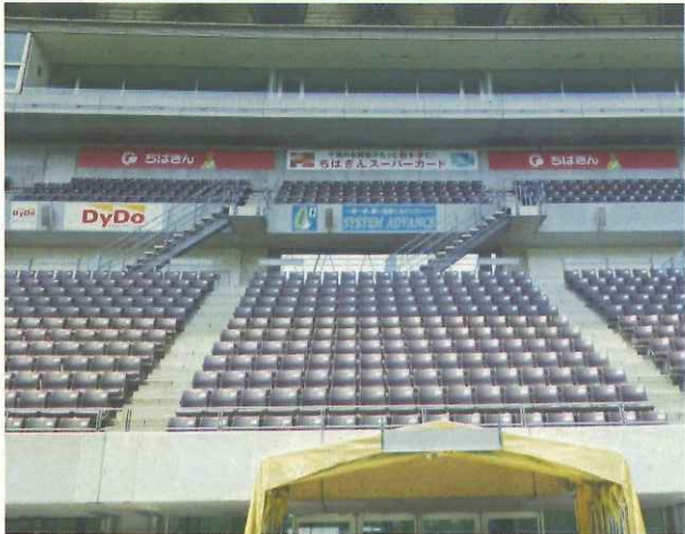
(フクダ電子アリーナ)