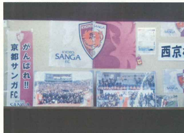
クラブショップ・ミュージアム イメージ