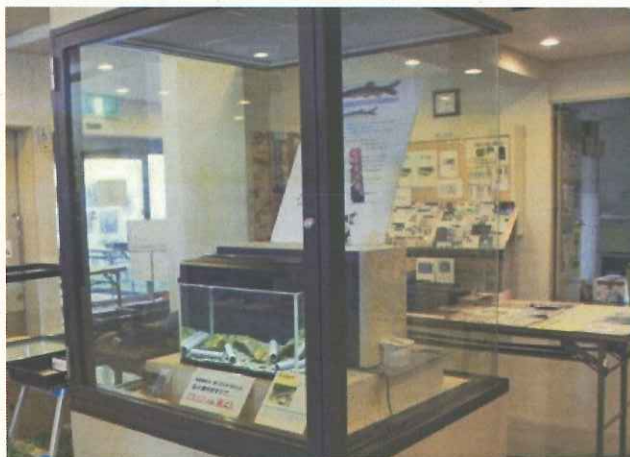
アユモドキ 展示イメージ