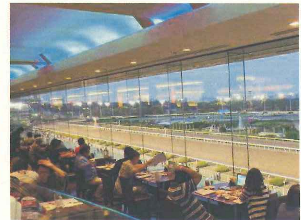
展望レストラン イメージ