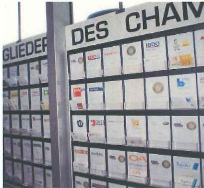
ビジネスチャンスが広がる名刺ボックス(ベルン)