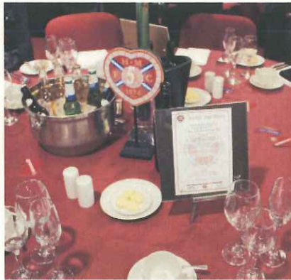
ゲストに満足してもらえるような雰囲気を出し出す(エジンバラ)