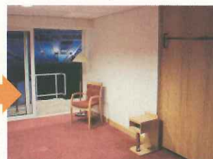
試合当日はベッドを収納し、スカイボックスとして使用