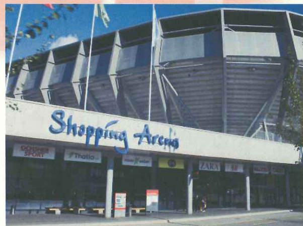
スタジアムに併設するショッピングセンター(ザクトガレン)