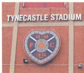
表札として(エジンバラ)

ユニフォームの左胸に配置されるのは、選手の心がクラブに帰属し、アイデンティティーの象徴を意味する。