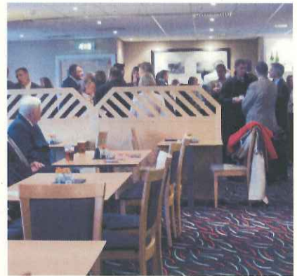
試合後のティーサービス(英国のシェフィールド・ユナイテッド)