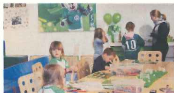
スタジアム内の託児施設(ヴォルフスブルク)