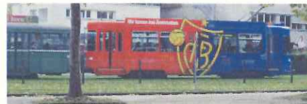
公共交通機関の利用を促進(バーゼル)