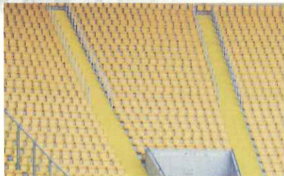
スタンドから階段までも(ドレスデン)