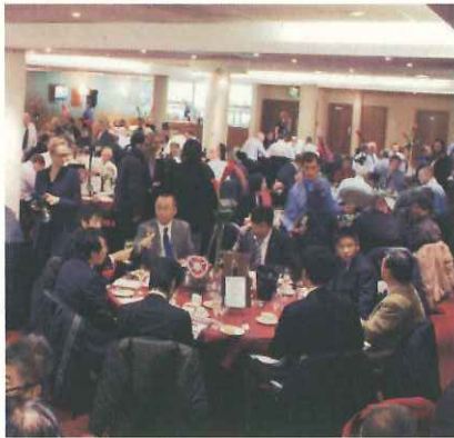
ラウンジの円形テーブルに集い、キックオフ前の時間を楽しむ(エジンバラ)

マクデブルクには、一般客向けのラウンジもある。メインスタンドの観戦チケット、ビュッフェ形式の食事とティーサービスが付き、日本円で一人約1万4000円。ラウンジ運営には、充実したケータリング設備とサービスが前提である。