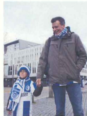
マクデブルク (ドイツ)の親子連れ

性別、年齢、ハンディを超えて、誰もが安心して楽しめる空間。 交通アクセス、屋根のある個席、ナイター照明、バリアフリー