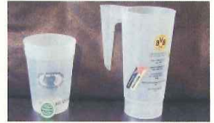
リユースカップはクラブ独自のデザイン(左はアイントラハト・フランクフルト、右はボルシア・ドルトムント。ともにドイツ)