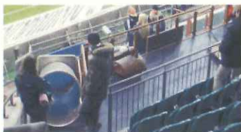
保護者も安心のキッズスペース(ヴォルフスブルク)