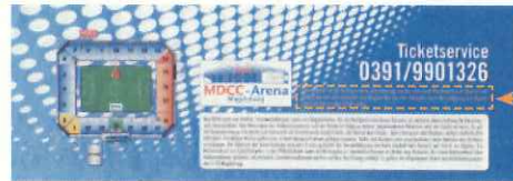
コンビチケットの例(マクデブルク)