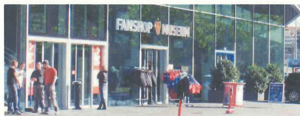
スタジアムに併設されたファンショップとミュージアム(バーゼル)