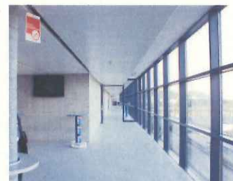
ラウンジなどとしても利用できる快適なコンコース (スイスのザンクトガレン)