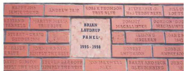
購入したブロックに自分の名前を彫り、外壁に張られる(レンジャーズ、グラスゴー)