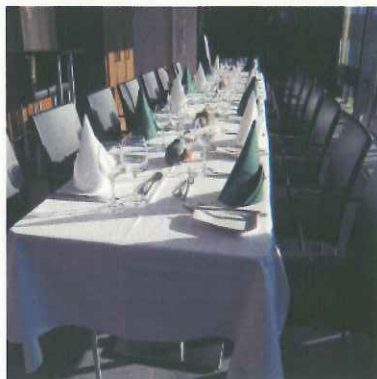
14人用個室ラウンジ(ザンクトガレン)