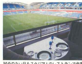
試合のない日もスタジアムのレストランで食事ができる(英国のボルトン)