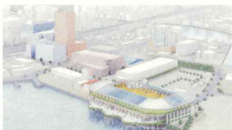
北九州市が打ち出した新スタジアム構想図(2010年11月17日の記者発表資料より)

わが国でも2010年11月、北九州市が新幹線小倉駅の北500メートルに、ギラヴァンツ北九州(J2)のホームスタジアムとして街なかスタジアム計画を打ち出した。