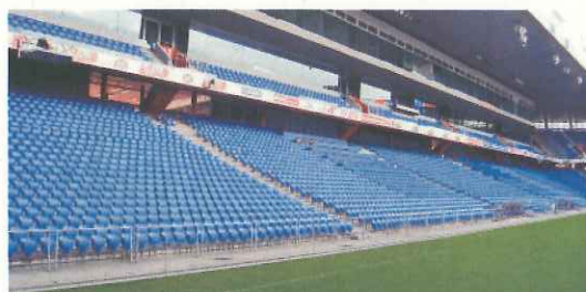
最前列の席はピッチと同じ目線に（スイスのバーゼル）

2010年6月に開催された第11回全国ホームタウンサミットin甲府の参加者約300人によって、「最もお気に入りのJリーグホームスタジアム」に選ばれたベスト5は、すべてサッカースタジアムだった。