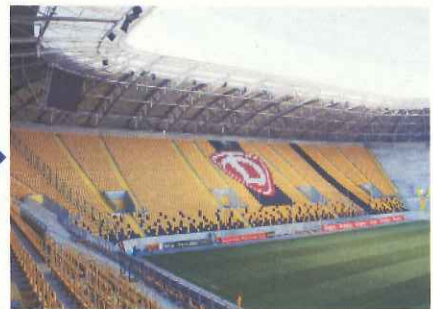
現在のドレスデンの新スタジアム