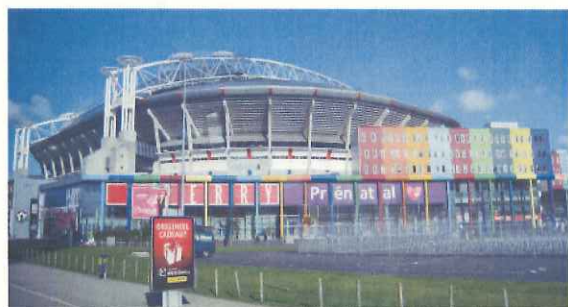
ショッピングモール(手前)とアムステルダム・アレナ(オランダ)

郊外の再開発プロジェクトの核として、面開発の複合型の街づくりが行われる。公共交通や十分な駐車場整備に加え、パーク&ライド整備が必要である。