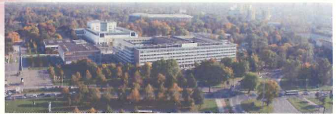
緑に囲まれたスタジアム(ドレスデン)