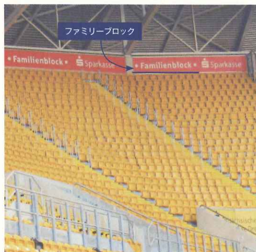
赤い看板の下のブロックがファミリースタンド(ドレスデン)