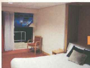
ピッチに面したホテルの客室(英国のコベントリー)