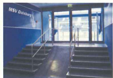
下からの選手入場口（ドイツのデュイスブルク）