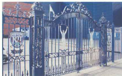
偉大なストライカー、ジェフ・アスルをたたえたゲート(ウェストブロムウィッチ)