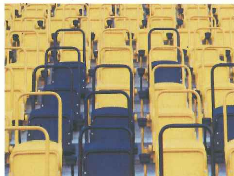
スタンド上部座席の安全柵(ドレスデン)