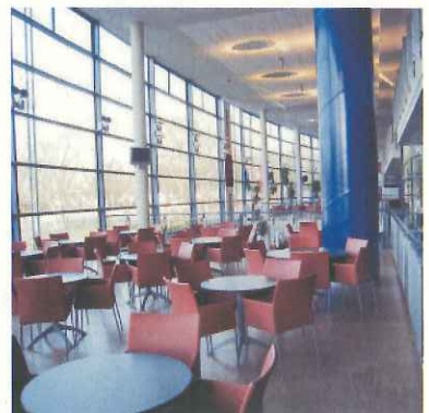
シンプルなラウンジ(デュイスブルク)