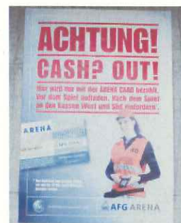
写真のカード販売員が コンコース内でチャージ もする(ザンクトガレン)