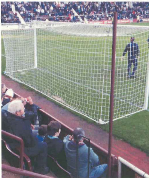
ゴール裏の席はネットに手が届きそうな近さ（英国のエジンバラ）