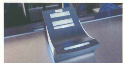
物販、飲食はこのカードリーダーで電子決済(ザンクトガレン)