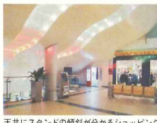
天井にスタンドの傾斜が分かるショッピングセンター内部(パーゼル)