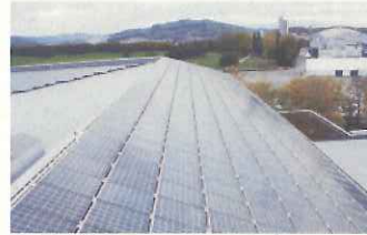
電力を供給するスタジアム屋根上のソーラーパネル(ベルン)