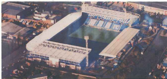
現在の欧州では箱型の「サッカースタジアム」が主流（英国のウェストブロムウィッチ）