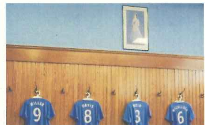
エリザベス女王の写真の真下はキャプテンの位置と決まっている(レンジャーズ、グラスゴー)