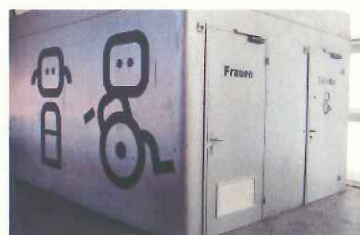
分かりやすいトイレの案内表示(バーゼル)