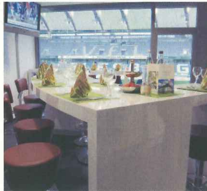
個室スカイボックス。契約企業は独自にインテリアをデザイン(ともにヴォルフスブルク)