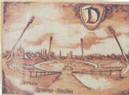
かつてのドレスデンのスタジアム。陸上競技のトラックがあり、屋根はなかった

スポーツが文化と認められる舞台は、競技の専門性と感動を最大限に引き出す「劇場」スタイルでなければならない。だから、サッカースタジアムは大前提となる。