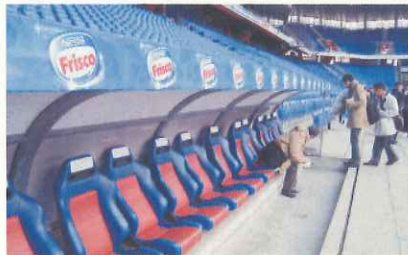
ホームチームのベンチ(バーゼル)