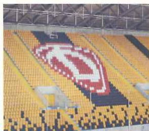
スタンドにも(ドレスデン)