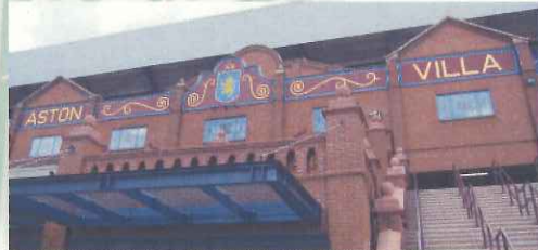
エンジと水色が外壁に。アストン・ヴィラのピラパーク(英国のバーミンガム)

クラブカラーは「ホームタウンの色」、一目で味方と対戦相手が識別できる。クラブカラー一色に染まったスタジアムから、選手は心理的優位をもらい、市民は誇りを抱く。