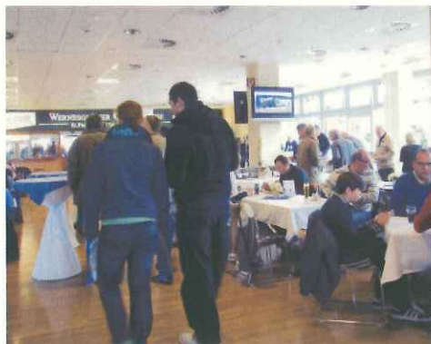
一般客向けのラウンジ(マクデブルク)