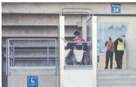
車椅子用の専用リフトが稼働中(マクデブルク)