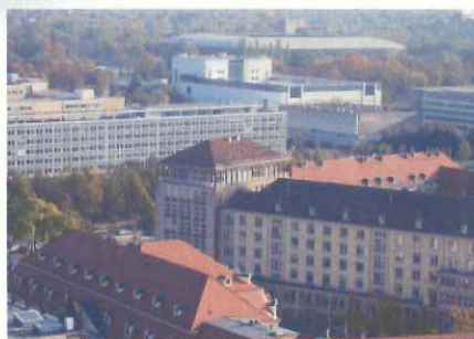
市街地にあるスタジアム(ドレスデン)

年間を通して週末ごとに、多いときには万人単位の巨大集客装置となる。千人単位のアウェイファン・サポーターも、試合の前後は「観光客」。スタジアムへのアクセスは徒歩が中心となり、観客が長く滞留する街の仕掛けがあれば、中心市街地に大きな経済効果をもたらす。