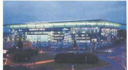
緑にライトアップ(ドイツのヴォルフスブルク)