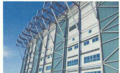
セルティック・パークの外壁(英国のグラスゴー)