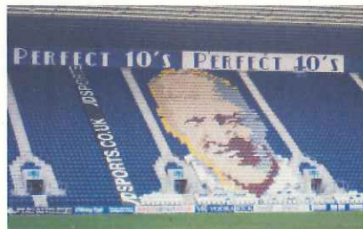
かつての名選手、ビル・シャンクリーの顔でホーム側とアウェイ側が仕切られるスタンド(英国のプレストン)