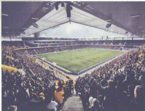
四方が屋根で覆われたスタジアム(スイスのベルンの絵はがきより)