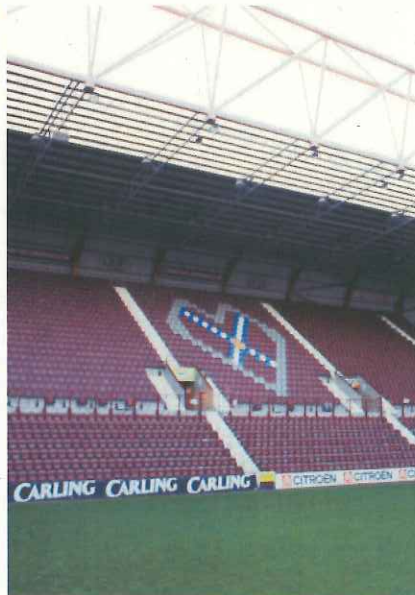
スタンドの傾斜角がピッチを近づける。最大で40度のところも（エジンバラ）

陸上競技のトラックがあると、Jリーグのスタジアムのゴール裏で最長45メートルもピッチから離れ、試合が見づらく、選手もプレーしにくい。サッカースタジアムはどの角度からも選手と観客の距離が近く、一体感が生まれる。芝生の緑、カラーコントラストの効いた両チームのユニフォーム、プレーに反応して波打つ観客、すべての臨場感が一つの画面から伝わってくる。