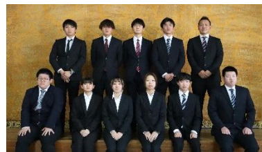
令和7年度 卒業研究発表会