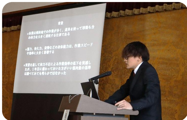
【林業マンに必要な筋肉量について調査】

学生たちには、卒業研究を最後まで粘り強く取り組んだ経験を糧に、卒業後もそれぞれの現場で活躍してほしいと思います。