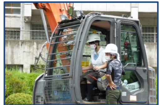
2年生による高性能林業機械操作指導

2年生による高性能林業機械の実演では、スムーズな操作を披露できました。また、操作体験の指導も行い、大変頼もしい姿を見ていただくことが出来ました。