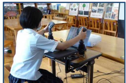
ハーベスタシミュレーターの操作体験