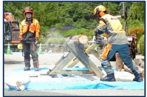
1年生によるチェーンソーを用いた丸太切り実演

2年生による高性能林業機械の実演では、スムーズな操作を披露できました。また、操作体験の指導も行い、大変頼もしい姿を見ていただくことが出来ました。