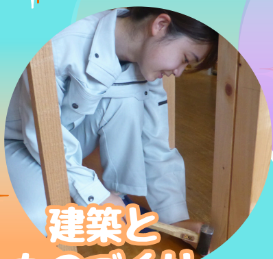
建築と ものづくり