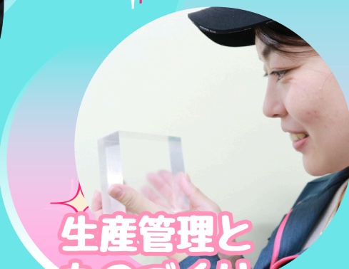
生産管理と ものづくり