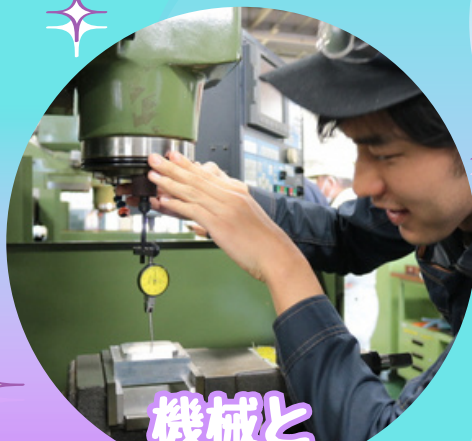
機械と ものづくり