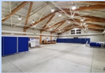
①CIQエリア (出入国管理)

①② CIQエリア 税関(Customs) 出入国管理(Immigration) 検疫(Quarantine)