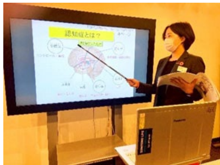
【オンライン研修の講師の様子】

弊社では認知症への理解を深め、お客さまに寄り添った対応ができるように、「認知症サポーター」の養成に取り組んでいます。2021年度より入社後の初期教育のカリキュラムに導入することで、全職員が認知症サポーターとなるべく推進しております。 (コロナの影響により「認知症サポーター」養成講座が一時中断となりましたが、オンライン研修に切替えて実施しております。)