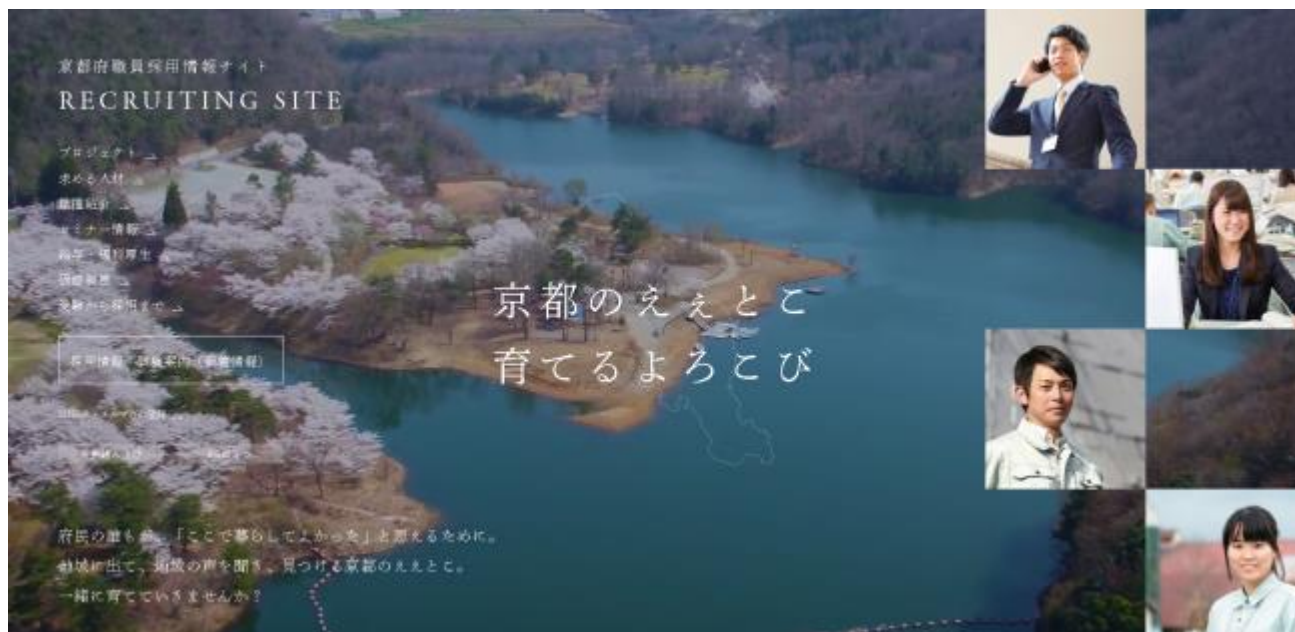
※リニューアルサイトのトップ画面