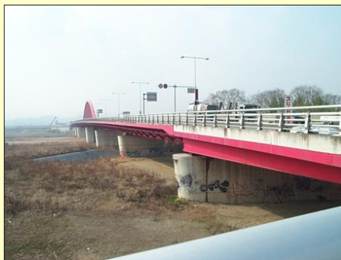
国道307号 (城陽市～京田辺市)