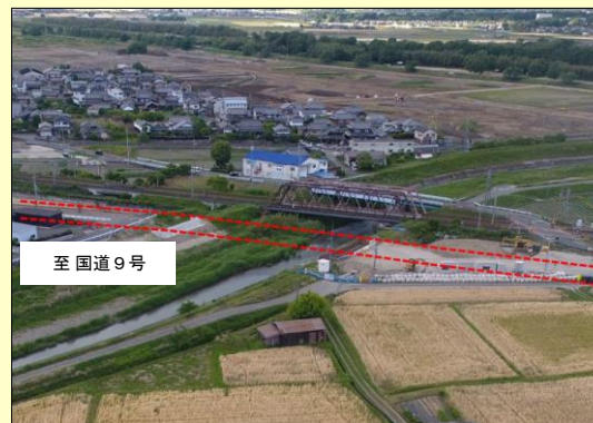
(都)並河亀岡停車場線 (亀岡市)