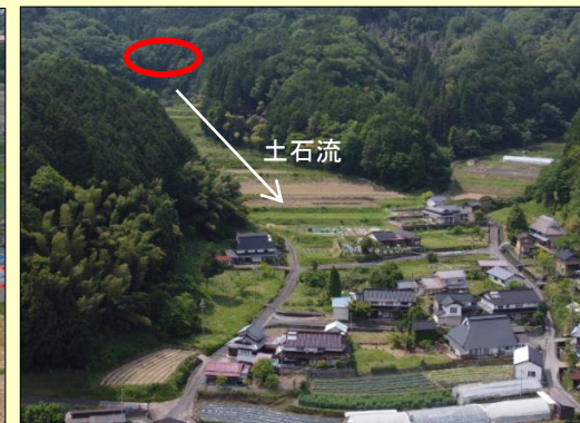
おおずらかわ 大空川 (福知山市)