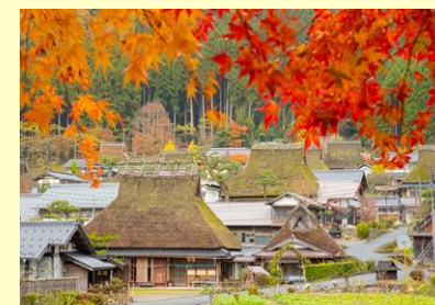
かやぶきの里(美山)