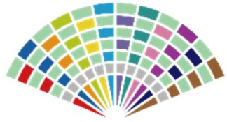
京都府生涯現役クリエイティブセンター