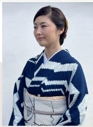
京都府文化観光大使 俳優 常盤 貴子氏