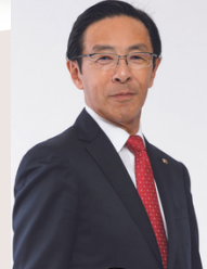
京都府知事 西脇 隆俊