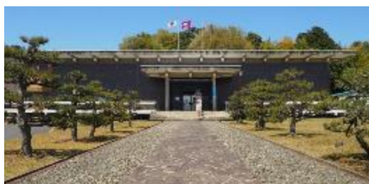
現在の丹後郷土資料館