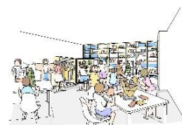
多目的室 (新館地下1階)