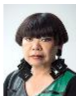
アドバイザー コシノ ジュンコ デザイナー