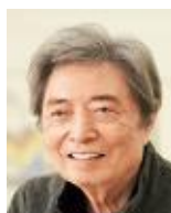
アドバイザー ほそかわ もりひろ 細川 護熙 陶芸家/芸術家