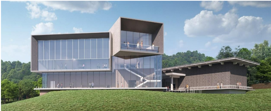
外観イメージ（東南側）