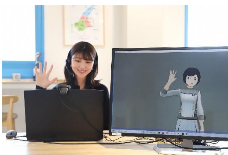
アバター操作の様子

ロボットが動くロジックと必要なプログラミングが親子で学べる体験教室や、専用のコントローラーを使ってカメラ付のロボットを操縦する体験等