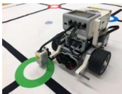
プログラミング教室で使用するロボット