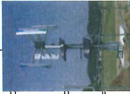
市内に設置の小型風力(例)