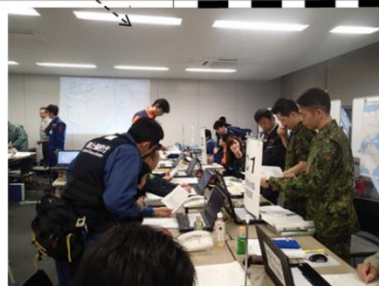
オペレーションルーム(和歌山県)内閣府HP