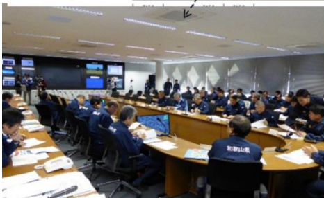
災害対策本部(和歌山県)