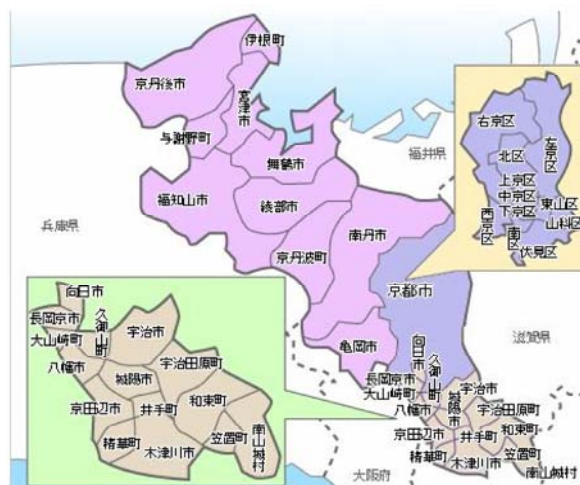
京都府内の行政区界